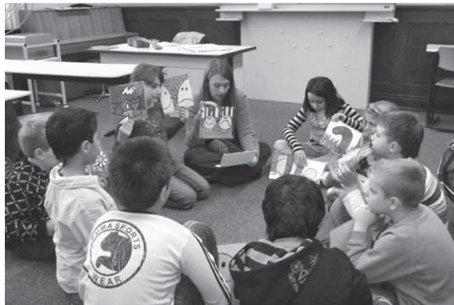
Die Förderung bei MAUS orientiert sich an den individuellen Bedarfslagen der Kinder

Die Schule selbst bestimmt also das inhaltliche Angebot und orientiert sich an den individuellen Bedarfslagen ihrer Schülerinnen und Schüler. Angebote werden insbesondere für die