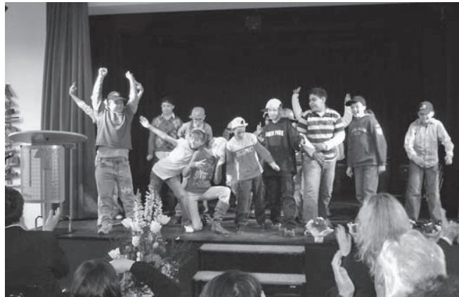
Die Freude am Lernen und persönliche Talente fördern mit MAUS

plementiert ist. Vom Prinzip her ist MAUS flexibel in der Handhabung und kann den aktuellen Bedingungen entsprechend kurzfristig initiiert werden. So lassen sich Zahl und Zusammensetzung der teilnehmenden Schulen und kommunalen Bildungspartner nach der Datenlage des kommunalen Bildungsmonitorings anpassen.